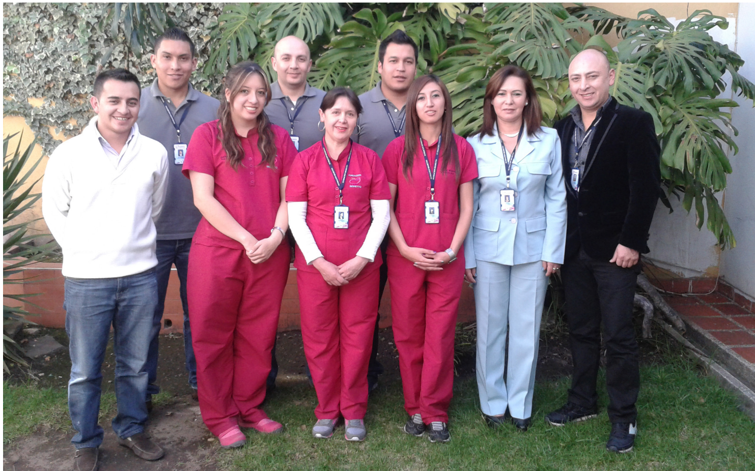
Equipo transdisciplinario. Programa SRPA.

Los adolescentes y jóvenes que demandan servicios en este programa presentan en su mayoría, características personales de inestabilidad familiar y social, con ausencia de oportunidades ocupacionales provenientes de diferentes barrios de la Ciudad de Pasto y algunos sectores Suburbanos, enmarcadas en procesos de deterioro social, presentan descomposición familiar, desocupación, vagancia, deserción escolar y abandono por incapacidad de los posibles referentes parentales y afectivos para apoyar el adecuado crecimiento integral de sus hijos.