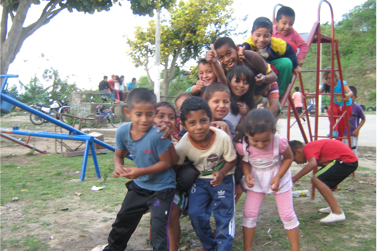
Niños y niñas corregimiento El Manzano - Cordón Panamericano.

Somos una fundación privada sin ánimo de lucro, integrada por un equipo Transdisciplinario de profesionales idóneos y capacitados que realiza todas aquellas actividades encaminadas a proyectar, ejecutar, administrar, coordinar y desarrollar planes, programas y proyectos orientados a prestar un servicio social a niños, niñas y jóvenes con problemas de comportamiento y a sus familias en especial comunidad más vulnerable. Se pretende por tanto a través de procesos formativos integrales garantizar el cumplimiento de los derechos fundamentales de los niños, niñas y jóvenes, mejorar su situación actual y articular herramientas que faciliten la construcción de un proyecto de vida sólido acorde a su interés superior bajo un enfoque sistémico relacional. La población vinculada fortalece valores encaminados al descubrimiento de: