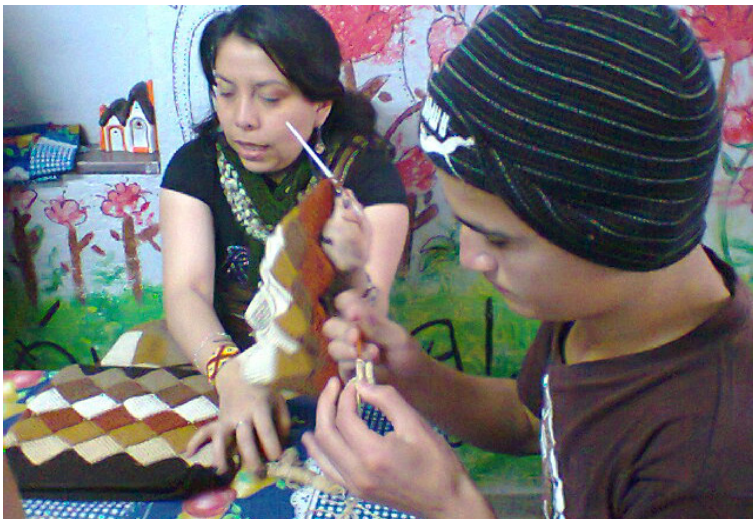
Actividades Artísticas y manuales. Programa Internado.

El programa propende por brindarles a los niños y adolescentes un hogar donde puedan recibir protección integral y desarrollar un proceso de formación personal a nivel físico, psicológico, intelectual, moral y espiritual, que favorezca su formación humana para una adecuada reinserción, a su medio familiar si existe y/o a la sociedad.