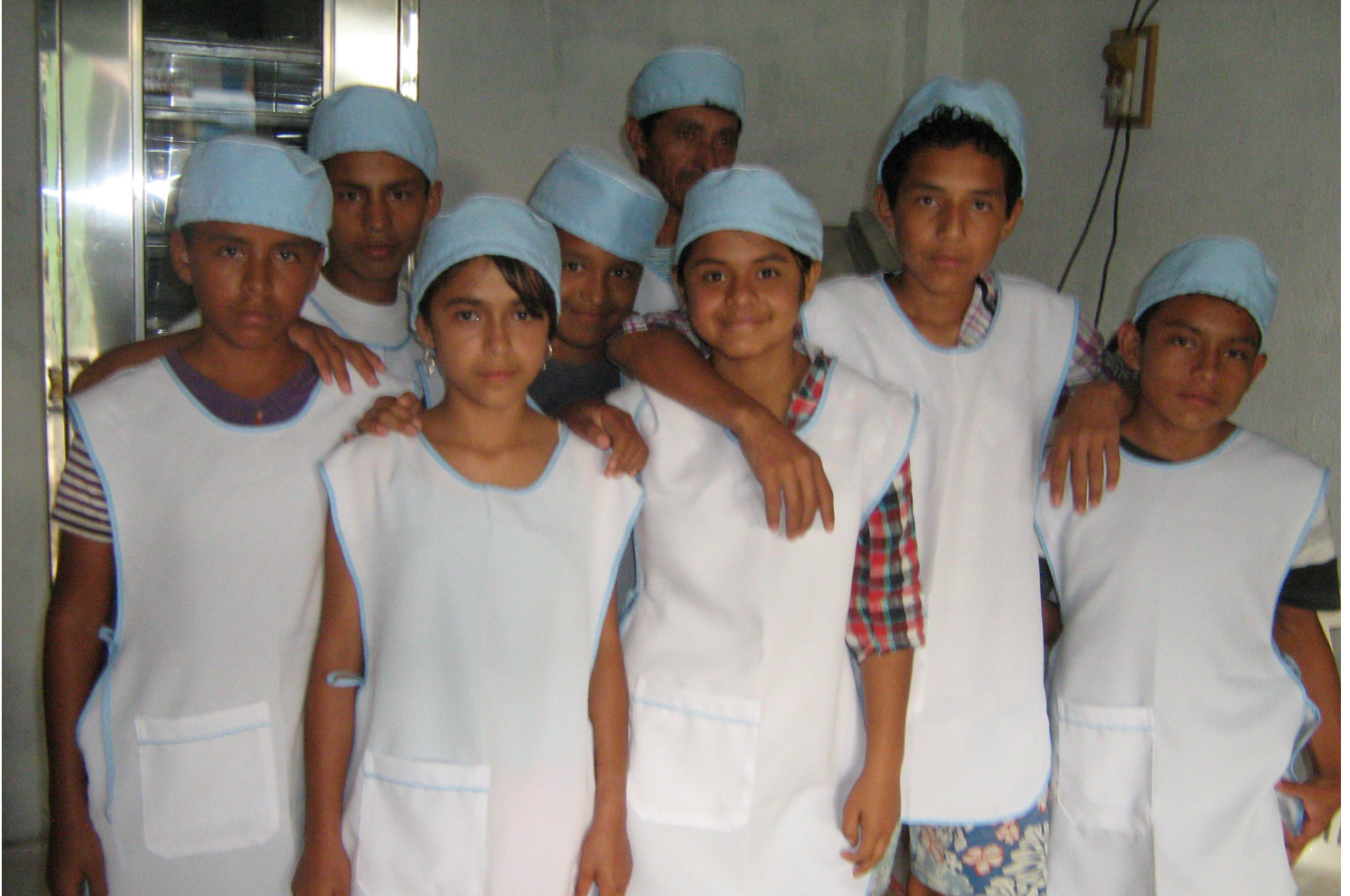
Adolescentes formación Pre-laboral. Panadería. Cordón Panamericano.

Ser una institución que respalde ampliamente al departamento de Nariño en el manejo integral de niños, niñas y jóvenes con problemas de comportamiento pertenecientes a contextos familiares y sociales conflictivos; logrando la ampliación de servicios y el reconocimiento de estamentos públicos y privados que posibiliten una amplia cobertura a las necesidades de la población y a los criterios para el mejoramiento de su calidad de vida.